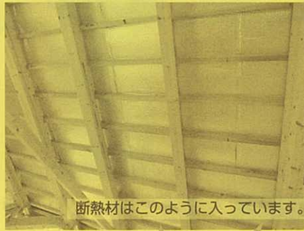
断熱材はこのように入っています。

ぜひご予約ください 紙面では伝えきれないこだわりを 詳細までゆっくりご説明いたします。