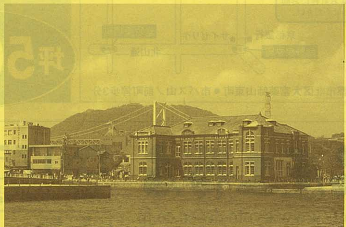
※写真は旧門司税関