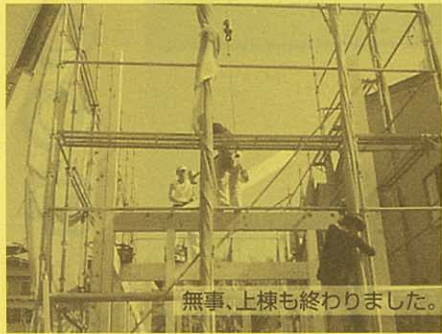
無事、上棟も終わりました。