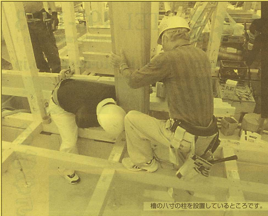
檜の八寸の柱を設置しているところです。